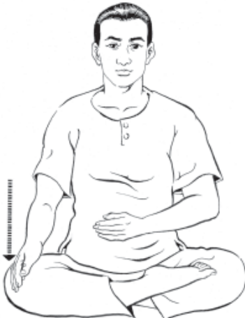
๑๐. ลดมือขวาลงที่ขาขวา ตะแคงไว้...ให้รู้สึก